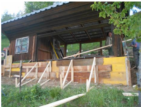
Slika 6: Utrditev betonskih temeljev.

Opravili smo izkop na zgornji strani čebelnjaka, ki je bil zasut z zemljo. Prednji in zadnji del pa utrdili z betonskimi temelji. Leseni konstrukcijski deli so ostali.