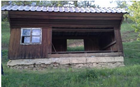
Slika 4: Stari čebelnjak spredaj.

je čebelnjak zaradi smrti čebelarja sameval. Ker je bil z ene strani zasut z zemljo, je les sčasoma preperel. Pokrit je bil z salonitno kritino, ki je bila dotrajana, saj je na enem delu že zamakalo. Propadli so tudi žlebovi. V notranjosti so se naselile kune, sršeni in mravlje. V čebelnjaku je bila še stara omara, stare satne osnove, leseni žebliji in drugo. Po temeljitim čiščenju smo se lotili njegove obnove.