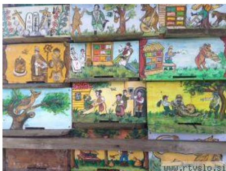
Slika 1: Panjske končnice.

Razvijajoče se žagarstvo je ponudilo čebelarjem ustrežnejše deske za izdelavo panjev, kot so bila drevesna debla. Tako so nastale truge ali kasneje poimenovani kranjski panji oz. kranjiči. Njihova velikost se je sčasoma spreminjala. Kot zanimivost kranjiča velja omeniti slikanje panjskih končnic. To se je zlasti razširilo na Gorenjskem in doseglo svoj višek v sredini 19. stoletja. Panjske končnice so biser slovenske kulturne dediščine. (Javornik 1982) Panje so poslikavali zato, da si je lahko čebelar lažje zapomnil značilnosti čebelje družine, čebele pa se lažje vračale vedno v isti panj. Najstarejša poslikana panjska končnica z motivom Marije, ki v naročju drži Jezusa, nosi letnico 1758. V prvem obdobju so se na panjskih končnicah pojavljali nabožni motivi, kasneje pa so se vedno bolj uveljavljale podobe iz življenja kmetov in obrtnikov. (Zdešar 2008)