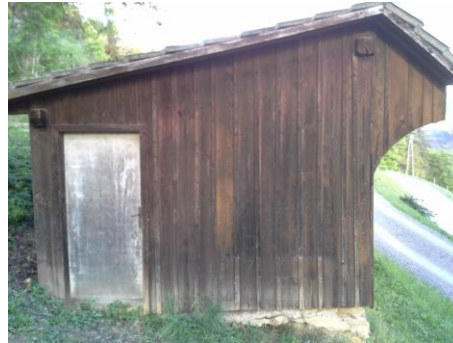
Slika 5: Stari čebelnjak s strani.

Opravili smo izkop na zgornji strani čebelnjaka, ki je bil zasut z zemljo. Prednji in zadnji del pa utrdili z betonskimi temelji. Leseni konstrukcijski deli so ostali.