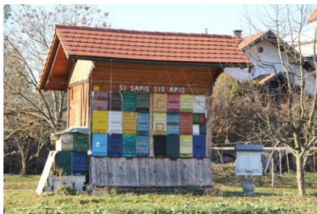
Slika 2: Čebelnjak na Brezjah.

Gorenci so ta napis prevedli malo po svoje in nastal je napis »Po bučelah se vižej!«