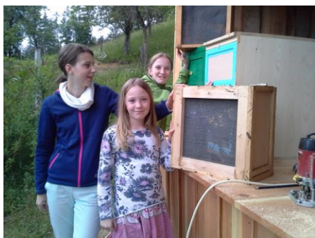
Slika 7: Prvi roj čebel v čebelnjaku.