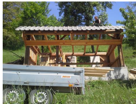
Slika 4: Menjava strešne kritine in desk.

Odstranili smo preperle deske in jih zamenjali z novimi. Uporabili smo les duglazije, ki ima lep rdečkast odtenek in daje čebelnjaku še bolj markanten videz. Mojster je menjaje vstavljajal svetlo rjavno desko in bolj rdečkasto.