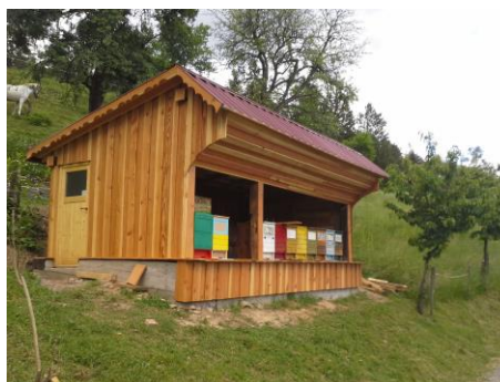
Slika 8: Čebelnjak s panji.

V spodnji tabeli je prikazana cena materiala, ki smo ga uporabili za obnovo čebelnjaka.